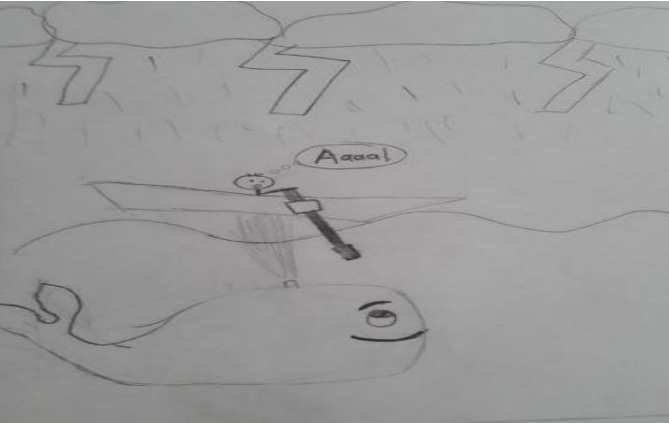
Şekil 4. Çizginin tamamlayıcı görünümü

Tablo 4'te “Dalgalı Çizgiyi” neye benzetirsiniz. Bu çizgiye baktığınızda size neyi çağırıyor? sorusuna verdikleri cevaplar Dalgalı Deniz, Bulut, Kuşun Kanat Çırpışı frekans değerlerinin az olmasına karşılık dağılımdaki çeşitlilik açısından oldukça farklı örnekler verildiği görülmektedir. Bu durum öğrencilerin “Dalgalı Çizgiyi” çalışmalarında kullanırken daha fazla örnekle ilişkilendirmesi açısından son derece önemlidir. Aşağıda öğrencilerin yaptıkları bu çalışmalardan Şekil-4 örnek olarak gösterilmiştir.