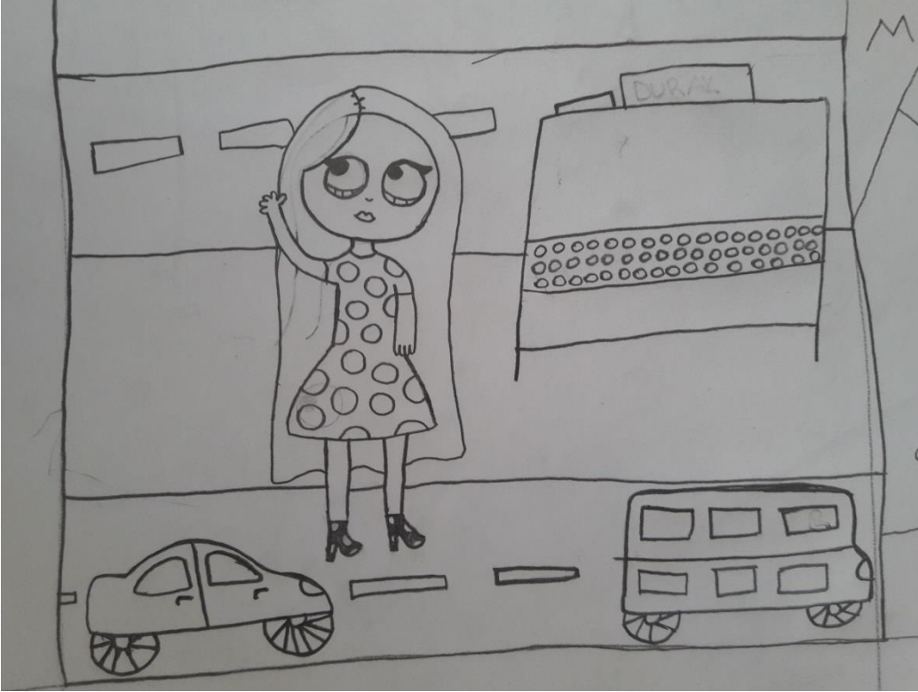
Şekil 1. Çizginin genel görünümü

Tablo 1'de “Düz Çizgiyi” neye benzetirsiniz. Bu çizgiye baktığınızda size neyi çağırıyor? sorusuna verdikleri cevaplar incelendiğinde Durgun Su, Yol, Düz Saç, Çerçeve, Su Borusu, Çalışkan Öğrenci frekans değerlerinin fazla olduğu diğer değerlerin az olmasına karşılık çeşitlilik açısından zengin bir içerik olduğunu göstermektedir. Bu durum öğrencilerin düz çizgiyi çalışmalarında kullanırken daha fazla örnekle ilişkilendirmesi açısından son derece önemlidir. Yapılan uygulamalı çalışmalar sınırlanmaması için öğrencilerden bütün çizgi çeşitlerinin bir arada gösterildiği çalışmalar yapmaları istenmiştir. Aşağıda öğrencilerin yaptıkları bu çalışmalardan Şekil-1 örnek olarak gösterilmiştir.