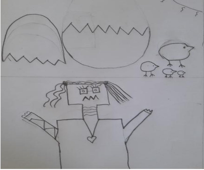
Şekil 3. Çizginin belirgin görünümü

görülmemektedir. Benzer çeşitlilik diğer çizgi çeşitlerinde olduğu gibi öğrencilerin “Zig zak Çizgiyi” çalışmalarında kullanırken daha fazla örnekle ilişkilendirmesi açısından son derece önemlidir. Aşağıda öğrencilerin yaptıkları bu çalışmalardan Şekil-3’te örnek olarak gösterilmiştir.